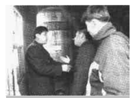
执法人员正在耐心向使用土锅炉的店主解释。

“土锅炉”每年都治理，可为什么总也铲除不尽。质监执法人员道出了其中的缘由。“土锅炉”的使用者多数是洗浴店和馒头房。开洗浴店的人大多社会背景比较复杂，他们为降低成本，用1000元左右的旧常压锅炉代替6000元左右的承压锅炉，且雇用社会上无证人员烧锅炉，安全隐患非常突出。如果不是多部门联合治理，暴力抗法的事件屡有发生，根治难度非常大。治理馒头房使用的“土锅炉”时，暴力抗法的事件较少，但其分布比较隐蔽，又都在居民聚集区，治理难度和隐患更大。针对这些情况，东营区质量技术监督局及时向东营区委、区政府作了专题汇报，得到了东营区委、区政府的高度重视，成立了由四部门组成的“土锅炉”专项治理小组，在全区开展为期7天的专项整治活动。这次区委、区政府决心要清除没完没了的“土锅炉”，对拒不按规定停止使用的“土锅炉”，决不留情现场切割解体，不留安全隐患的死角。