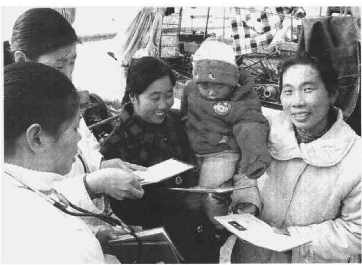
利津县刁口乡计生办针对本地渔民流动性强的现状，创建了“水上计生协会”，使渔民由昔日“水上漂”变为协会管理。

曹连杰强调，各级政府要切实加强对农村信用社工作的领导，主动搞好服务，把政府职能真正转到负责农村信用社的经营方向，负责组织防范和化解风险。