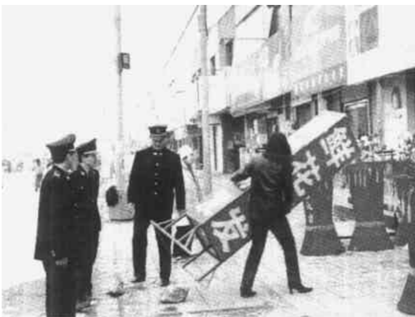
河口区大打创建国家卫生城市和国家环境保护模范城市攻坚战。图为河口区城建监察大队整治市容市貌。