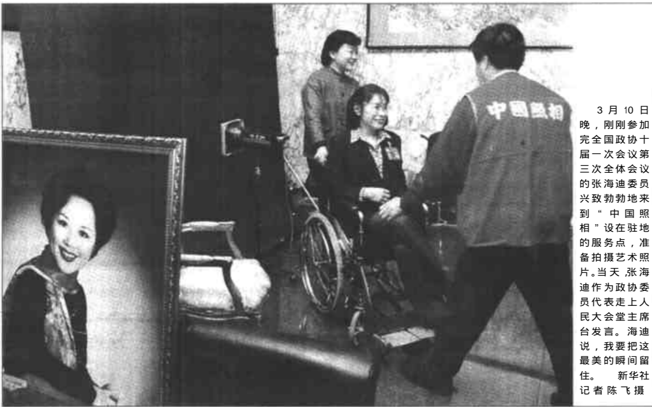
3月10日晚,刚刚参加完全国政协十届一次会议第三次全体会议的张海迪委员兴致勃勃地来到“中国照相”设在驻地的服务点,准备拍摄艺术照片。当天,张海迪作为政协委员代表走上人民大会堂主席台发言。海迪说,我要把这最美的瞬间留住。

出席今天茶话会的还有:王乐泉、王兆国、回良玉、刘淇、刘云山、吴仪、张立昌、张德江、陈良宇、周永康、俞正声、贺国强、郭伯雄、曹刚川、王刚、迟浩田、张万年、徐才厚、何勇、帕巴拉·格列朗杰、王光英、司马义·艾买提、王忠禹、阿沛·阿旺晋美、赵南起、白立忱,中央军委委员梁烈、廖锡龙、李继耐,中央和国家机关有关方面负责人,参加“两会”的各省、自治区、直辖市的负责人,香港特别行政区、澳门特别行政区和台湾代表团的负责人,部分老同志和在京的部分少数民族人士、民族工作者。