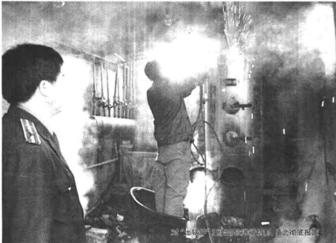
“土锅炉”隐患在市区角落内“隐形”炸弹之彻底报道

任凭你查封罚款，我自照烧不误。东营市50余家“土锅炉”又死灰复燃，冒起了黑烟。3月10日，东营区质量技术监督局下定决心，会同安监、公安等部门对辖区内馒头房、浴室等集中使用“土锅炉”的场所展开了为期7天的全面整顿，依法清理了繁华市区角落内的“隐形”炸弹。