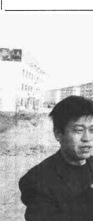
广饶县丁庄镇按照政府引导、多元投资、社会建城的思路，仅去年就启动和完成城镇建设项目4个，新增建筑面积1.2万平方米。其中，商贸面积5500平方米，住宅面积4000平方米，一座集行政、教育、文化、商贸于一体的现代化小城镇已初具规模。

教育事业的发展牵动着千千万万人们的心，人民群众从来没有像今天这样关注教育。这种关注归结起来集中到一点：教育质量。教育质量上不去，领导不答应，学生家长不答应，学生也不答应。而教育的发展需要各级党政领导和社会各界的关心、支持与广泛参与，需要有一个良好的社会发展环境。各级领导能否了解教育，进而关心、支持教育，取决于我们的工作。有工作思路，理念先进，能开拓创新，教育质量上去了，各级领导和全社会就会认可、认同我们的主张，进而关心、支持教育的发展。比如教育投入问题。各级党政领导重视教育工作至关重要，重视了，在教育